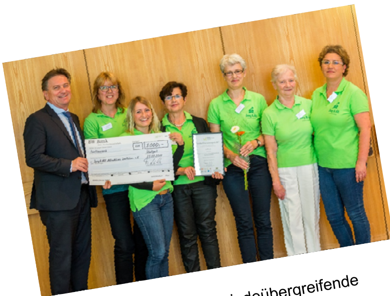
Organisierte, aktive, gemeindeübergreifende Nachbarschaftshilfe