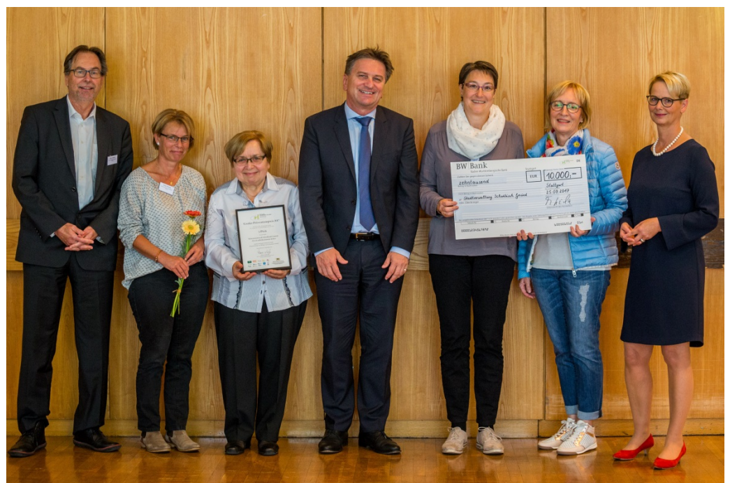
Seniorennetzwerk Schwäbisch Gmünd – für ein selbstbestimmtes Leben