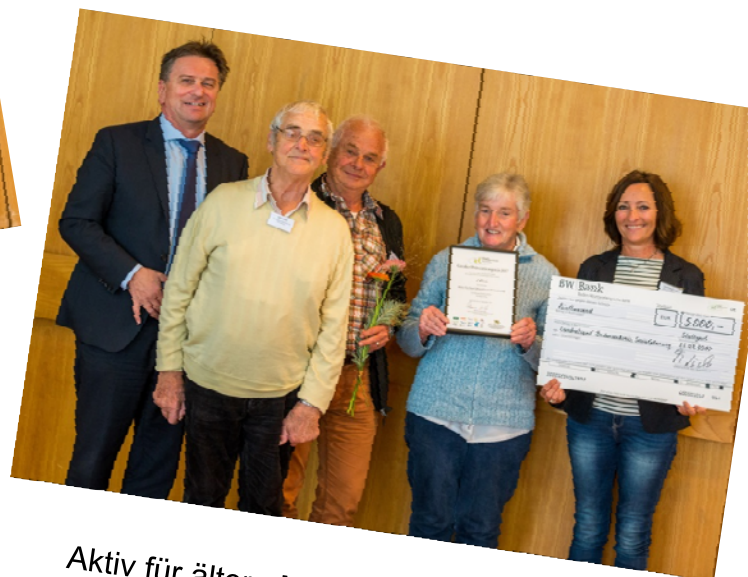
Aktiv für ältere Menschen mit Behinderung