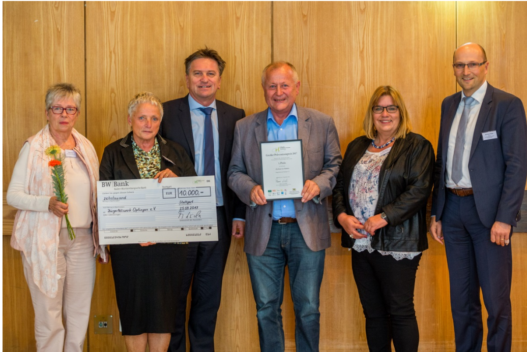
Zu Gast wie daheim