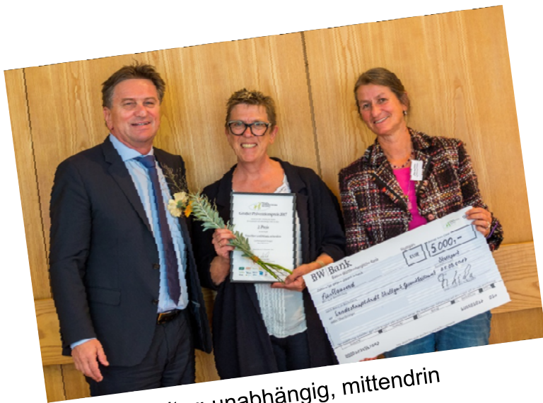
TrotzAlter: unabhängig, mittendrin