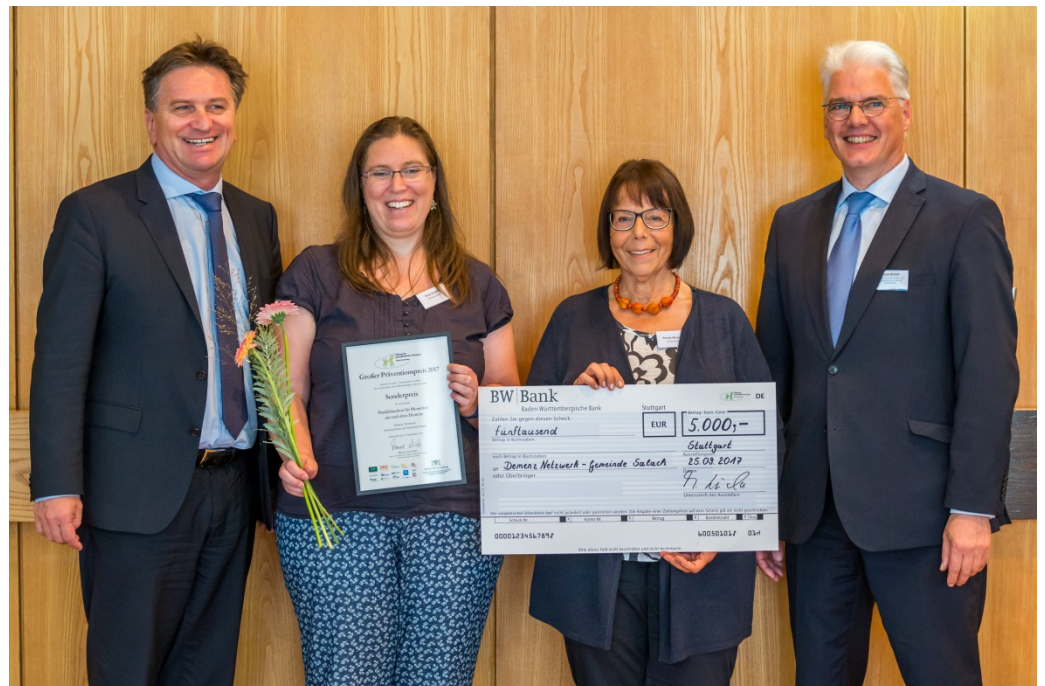
Paralleltandem für Menschen mit und ohne Demenz