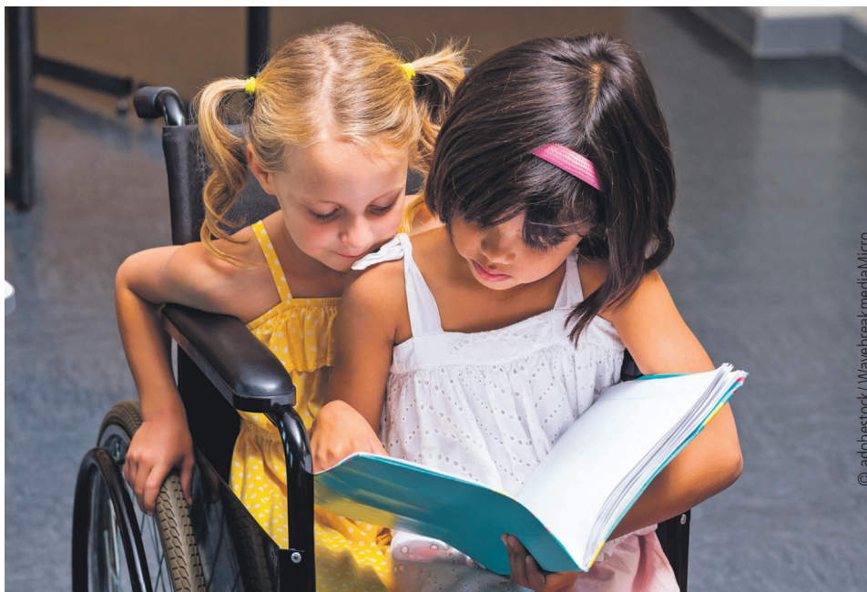
Gemeinsam in der Kita: so wird Inklusion selbstverständlich.