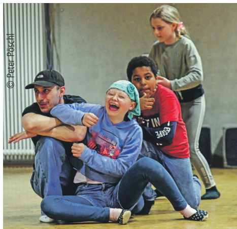
Gemeinsam Theater spielen

In den letzten zehn Jahren hat das gemischte Ensemble der fbs mit über 200 jungen Menschen aus mehr als 30 Ländern und drei Kontinenten zusammengearbeitet. In dem Ensemble begegnen sich Sonderschüler und KFZ-Mechaniker, Altenpfleger und Informatikerinnen, Geflüchtete und Studentinnen und viele mehr. Seit 2023 kooperiert das fbs mit dem Schauspiel Stuttgart. Der erste